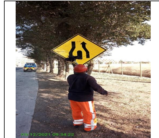
Mantenimiento y conservación de señales verticales