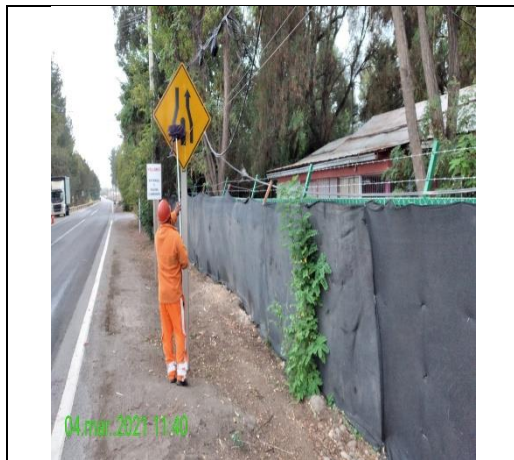
Mantenimiento y conservación de señales verticales

Mantenimiento de la infraestructura preexistente durante el periodo